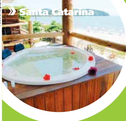
» Santa Catarina

Publicidade: 4735.8020 | e-mail: negocios@moginews.com.br | www.moginews.com.br